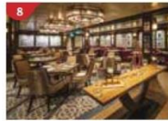
Bistro By Mark Best Relish contemporary Western cuisine from the internationally-acclaimed Australian chef.