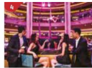
Bar 360 Catch live music and aerial acrobatic performances with a glass of champagne.