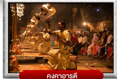
คงคาอารตี