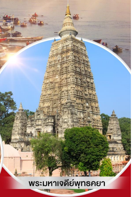
พระมหาเจดีย์พุทธคยา