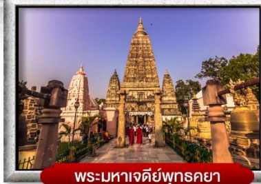
พระมหาเจดีย์พุทธคยา