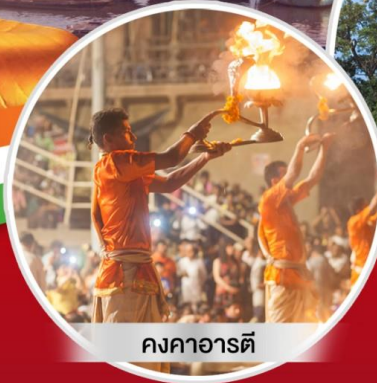
คองคาอาร์ท