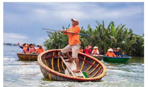
นั่งเรือกระด้ง