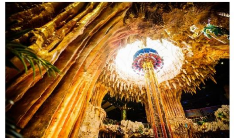
สวนสนุกแฟนตาซีพาร์ค