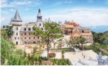
หมู่บ้านฝรั่งเศส