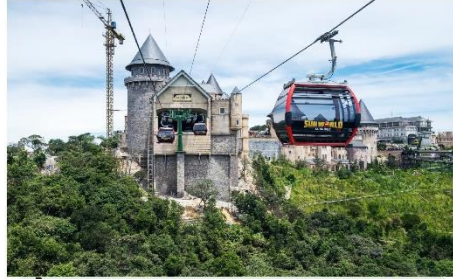
ขึ้นกระเช้าลอยฟ้า