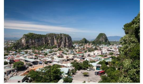
หมู่บ้านเกาะสลักหินอ่อน