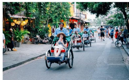
นั่งสามล้อชมเมืองฮอยอัน