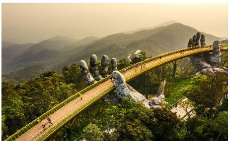
สะพานลอยฟ้า Golden Bridge