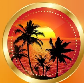
SUMMER มิถุนายน-สิงหาคม