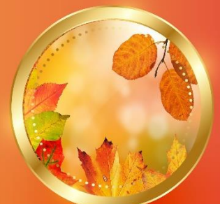
AUTUMN กันยายน-พฤศจิกายน