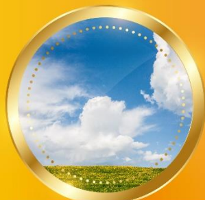
SPRING มีนาคม-พฤษภาคม