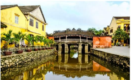
ฮอยอัน เมืองมรดกโลก