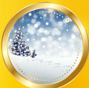
WINTER ธันวาคม-กุมภาพันธ์