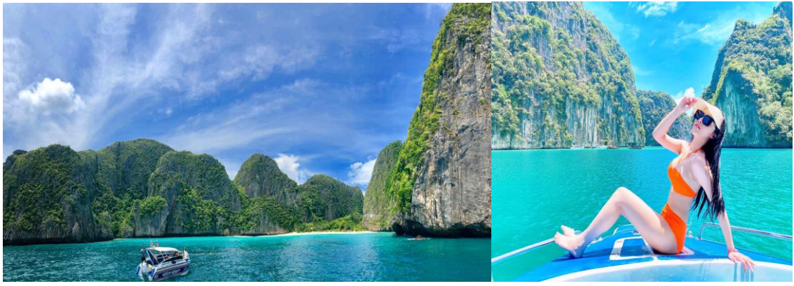
ลงเล่นน้ำดำสน็อกเกิล ชม ดอกไม้ทะเล และฝูงปลาการ์ตูน หน้าถ้ำไวกิ้ง