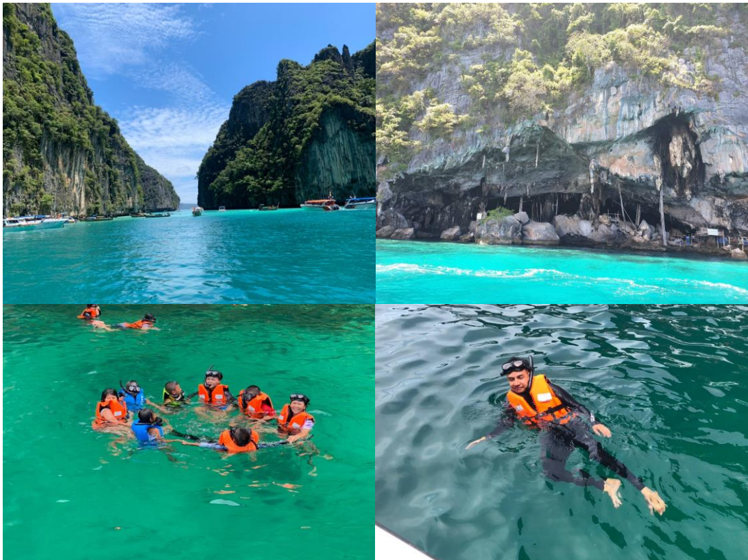
ออกเดินทางไปยังเกาะพีพีตอน