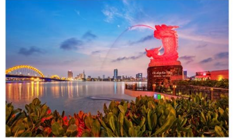
เซ็คอนคาร์พดาร์กอน