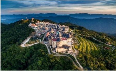
หมู่บ้านฝรั่งเศส