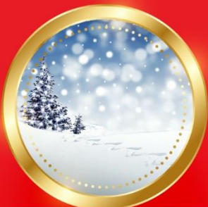
WINTER ธันวาคม-กุมภาพันธ์