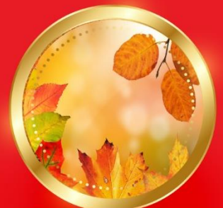
AUTUMN กันยายน-พฤศจิกายน