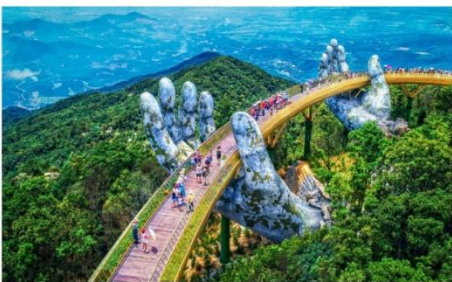
สะพานลอยฟ้า Golden Bridge