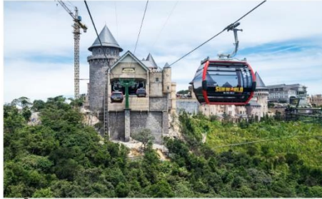
ขึ้นกระเช้าลอยฟ้า