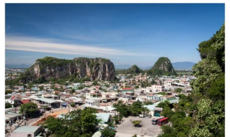
หมู่บ้านแกะสลักหินอ่อน