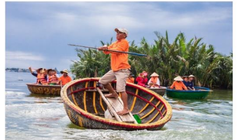
นั่งเรือกระด้ง