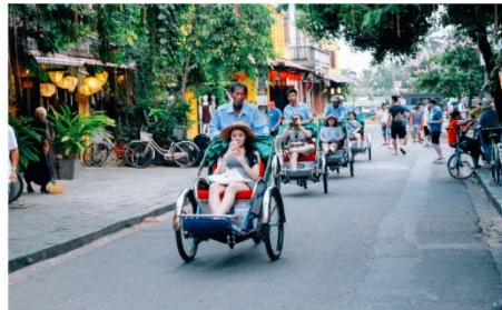
นั่งสามล้อชมเมืองฮอยอัน