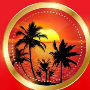
SUMMER มิถุนายน-สิงหาคม