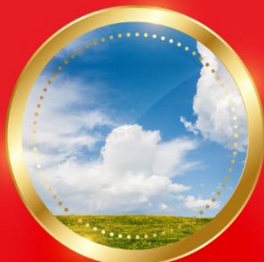
SPRING มีนาคม-พฤษภาคม