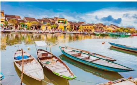
ฮอยอัน เมืองมรดกโลก