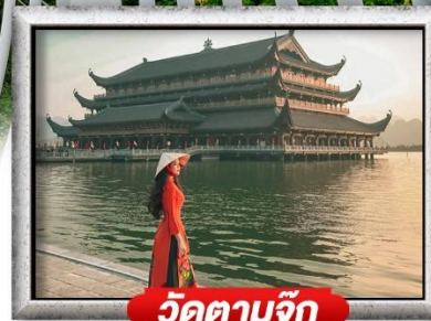
วัดตามจุก