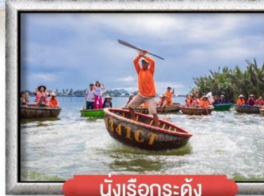
นึ่งเรือกระด้าง