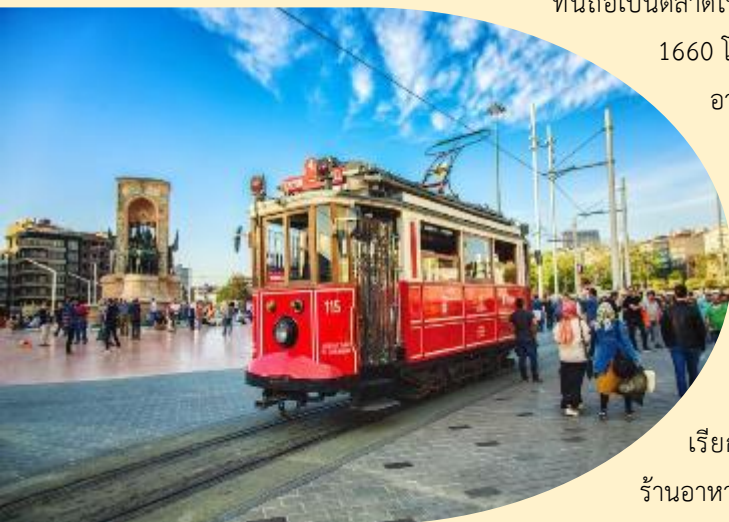
ของชาวเมืองอิสตันบูล

ร้านอาหารพื้นเมือง และยังมีแตรมบีโบริออน (Tram) เรียกได้ว่าที่แห่งนี้เป็นจุดนัดพบยอดนิยม