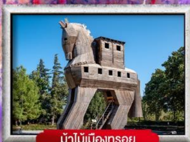
ม้าไม้เมืองทรอย