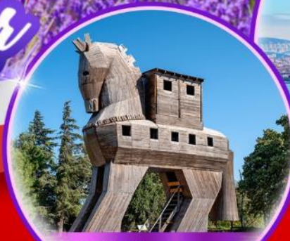
ม้าไม้เมืองทรอย