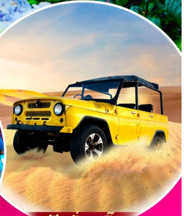
ฟรี! นั่งรถจี๊ป