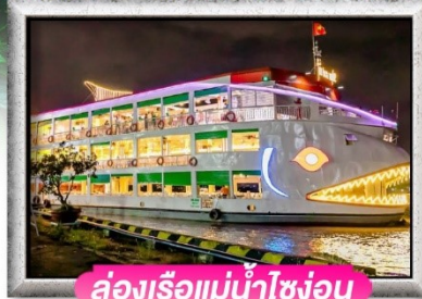
ล่องเรือแม่น้ำโขงอุ่น