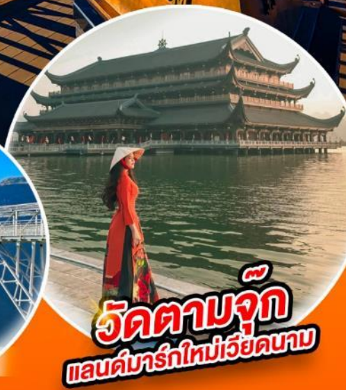
วัดตามจุก แลนด์มาร์กใหม่เวียดนาบ