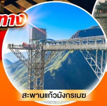
สะพานแกว้มิงกริมช