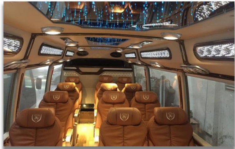
รถสำหรับ 15 - 45 ท่าน