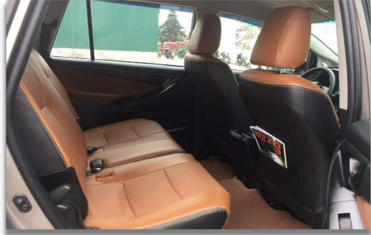
รถสำหรับ 3 - 8 ท่าน