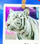
สวนสัตว์