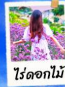
ไร่ดอกไม้