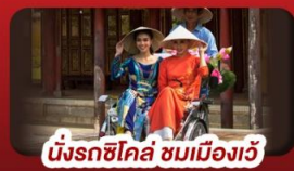
นั่งรถซิโคล์ ชมเมืองเว้