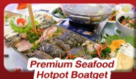
Premium Seafood Hotpot Boatget

นั่งกระเช้าที่ยาวที่สุดในโลก ขึ้นสู่บาน่าฮิลล์ ชมเมือง ฮอยอัน เมืองมรดกโลกที่สวยงามและเจียมสงบ พิเศษ!! บุฟเฟต์นานาชาติ บานาฮิลล์ และ Seafood