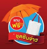
ฟรี! ชุดขึ้นจ่า