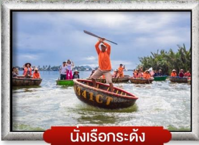
นิงเรือกระด้าง