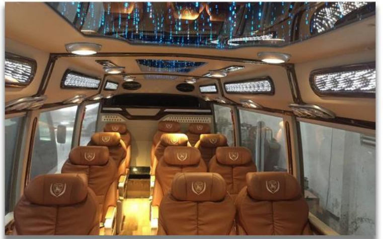
รถสำหรับ 15 - 45 ท่าน