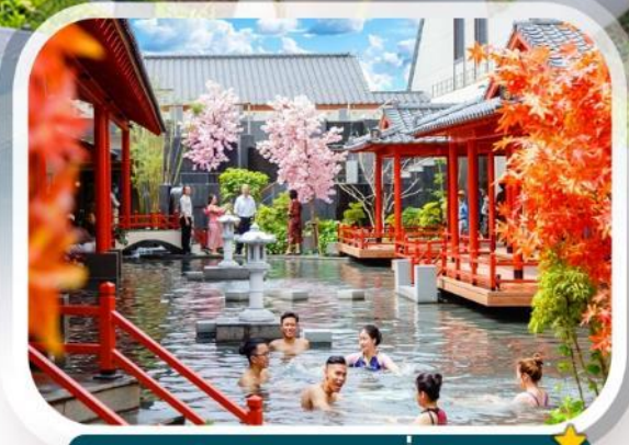
Mikazuku Resort ที่พัก 5 ดาว