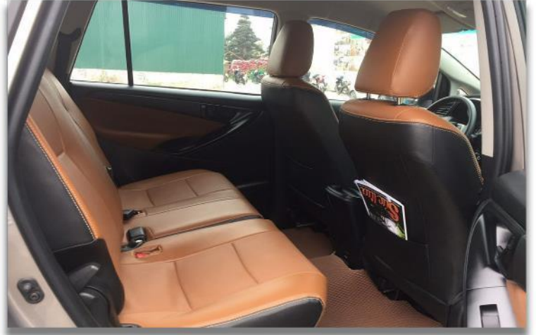
รถสำหรับ 3 - 8 ท่าน