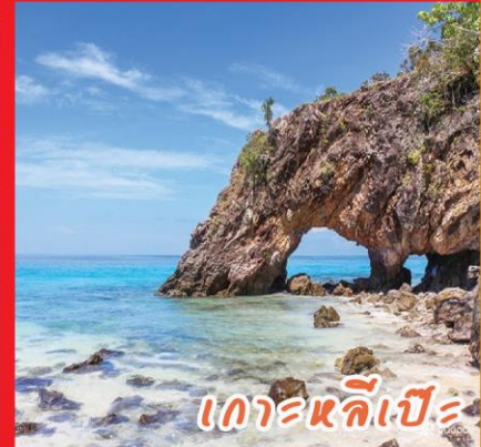
เกาะหลีเป๊ะ