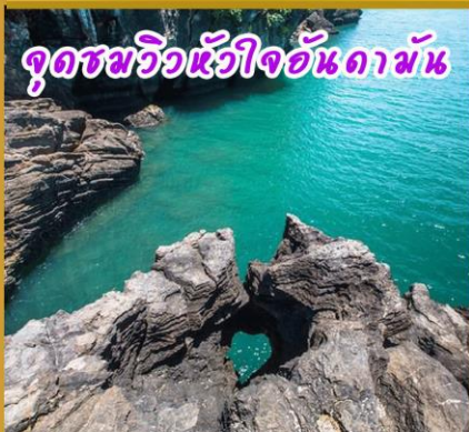
จุดชมวิวหัวใจอันดามัน