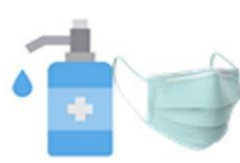
เจลแอลกอฮอล์