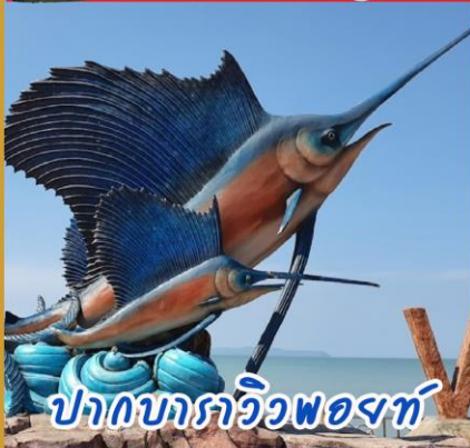
ปากบาราวิฬงพองท์