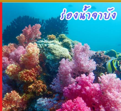
ร่องน้ำจางบัง