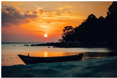
ค่ำ ที่พัก

จากนั้นนั่งเรือหางยาวสู่ เกาะราวี เป็นเกาะที่มีขนาดใหญ่ มีหาดทรายขาวมาก ๆ หาดทรายทอดตัวเป็นแนวโค้งยาวหลายร้อยเมตร ที่นี่จึงเป็นจุดสำคัญที่เหมาะสมสำหรับการพักผ่อนชิวๆ น้ำทะเลสีเขียวมรกต ซึ่งเป็นจุดที่มีปะการังน้ำตื้นที่สมบูรณ์และสวยงามที่สุดของทะเลอันดามัน