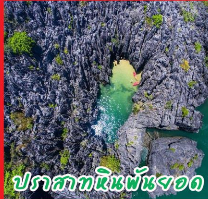
ปราสาทหินพันยอด