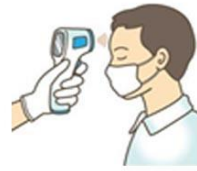
วัดไข้ผู้เดินทาง