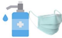
เจลแอลกอฮอล์