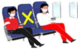
ที่นั่งบนเครื่องบิน