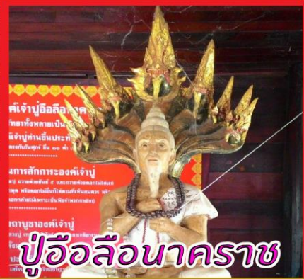
พระอัฐนาคราช