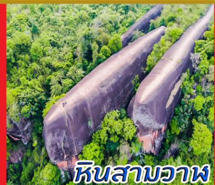
หินสามวาฬ