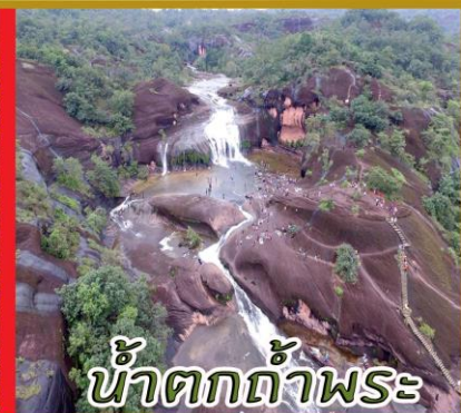
น้ำตกถ้ำพระ