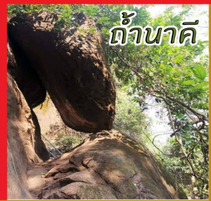
ถ้ำนาค้ำ