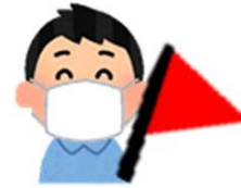
ใส่หน้ากากตลอดเวลา