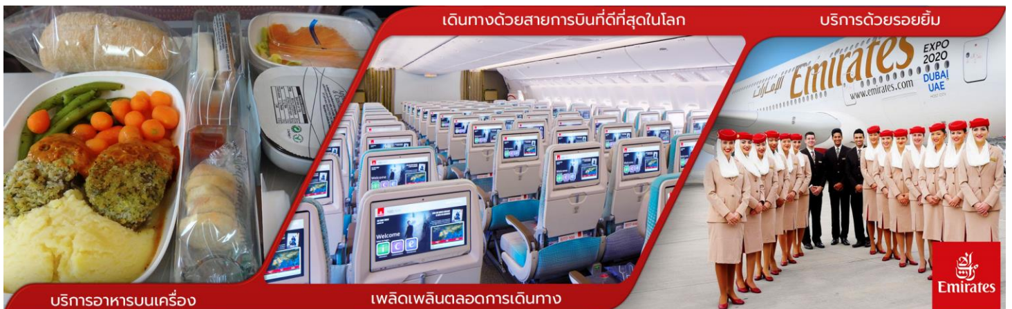
บริการอาหารบนเครื่อง

09.30 น. ✈ เห็นฟ้าสู่ ดูไบ โดยสายการบิน EMIRATES เที่ยวบินที่ EK375 AIRBUS A380 (บริการอาหารบนเครื่อง ใช้เวลาบิน 6.30 ชั่วโมง)