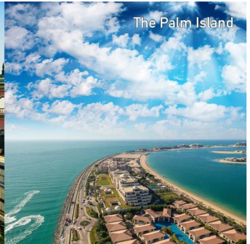
The Palm Island