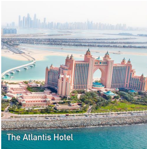
The Atlantis Hotel

ความสวยงามของภูมิประเทศ และบรรยากาศรอบๆ โรงแรมนี้ Palm Island เป็นโครงการมหัศจรรย์ที่คิดค้นสำหรับรองรับการอยู่อาศัยในอนาคต สร้างโดยการนำทรายมาถมทะเลเป็นเกาะเล็กๆ รวม 301 เกาะ รูปร่างหากมองจากด้านบนรูปต้นอินทผลัม (The Palm) และ โครงการ The World จะเห็นเป็นรูปแผนที่โลกนำท่านช้อปปิ้ง ห้างดูไบ เอ้าท์เลท วิลเลจ (DUBAI OUTLET VILLAGE)