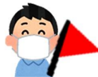
ไกลใส่แมส ตลอดเวลา