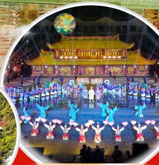
ชมโชว์ที่ Grand World