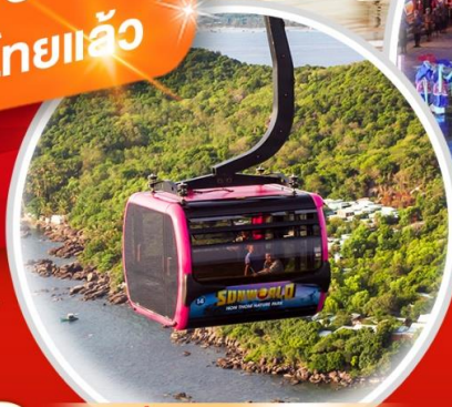
นั่งกระเช้าไฟฟ้า