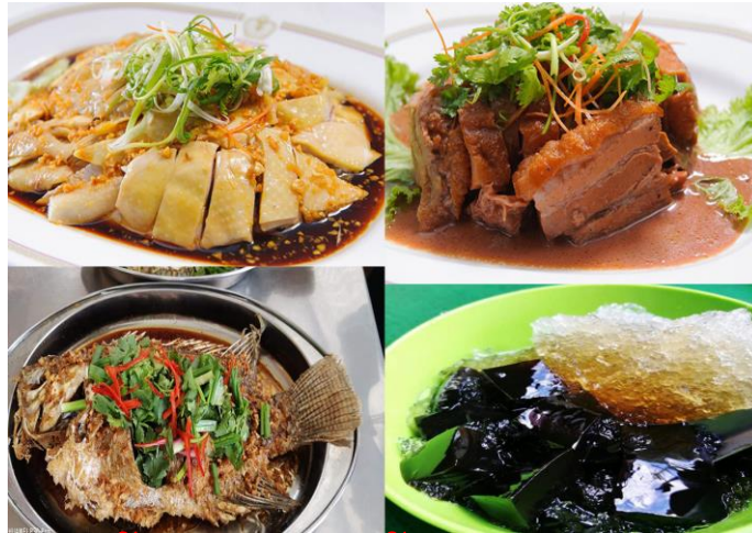
ลิ้มลองอาหารขึ้นชื่อของเบตง