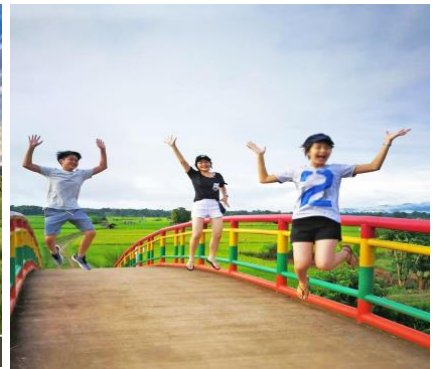
ร่วมตัดบาตรยามเช้า เติมนบุญให้ชีวิต ณ สะพานบุญ

09.00 น. หลังเช็คเอาท์ นำท่านเดินทางไปยัง กาแฟบ้านไทลื้อ ให้ท่านได้ลิ้มลองกาแฟอาราบิก้ารสเลิศ ผลผลิตชาวน่าน ร้าน เก้ ไร่ กลางทุ่งนาข้าวแฝงไปด้วยบรรยากาศแบบไทลื้อดั้งเดิม เมื่อได้เห็นต้องร้องว่าน่าซื้อ เครื่องดื่มชัคแก้ว ไปนั่งเล่น นอนเล่น รับลมเย็น มองดูวิวนาข้าวและขุนเขาที่อยู่เบื้องหน้า พร้อมถ่ายภาพเซ็ดอิน เก้ ไร่ ยังกระท่อมปลายนาในแบบฉบับที่ไม่เหมือนใคร ต่อไปยัง ลำดวนผ้าทอ อิสระเลือกซื้อผ้าทอมือ ผีมือชาวไทลื้อ