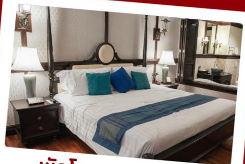
พักโรงแรม 5 ดาว