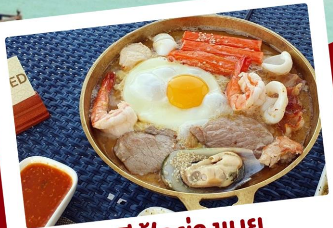
ซีฟู้ดย่างนย