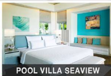
POOL VILLA SEAVIEW