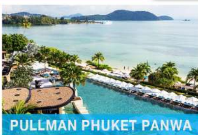
PULLMAN PHUKET PANWA