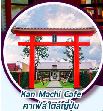
Kan Machi Cafe คาเฟ่สไตล์ญี่ปุ่น