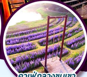
กาแฟกลางชนเขา The Village Farm to Cafe