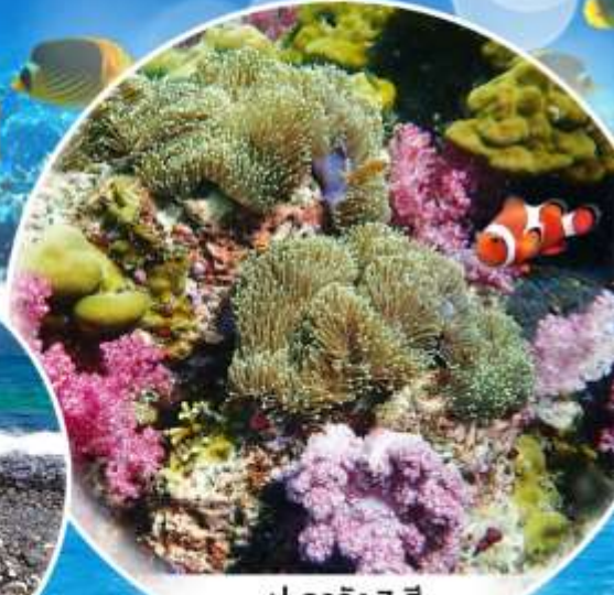
ปะการัง 7 สี

มหัศจรรย์ เกาะหลีเป๊ะ ฟ้าเขียวสวย กุมา - เมษา