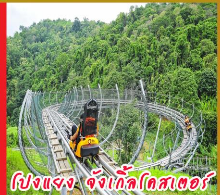
โปงแจง จังเกิ้ลโคสเตอร์