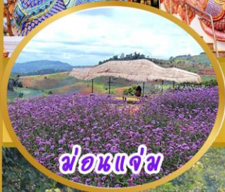
ฟ่อนแจ่ม