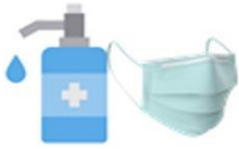
บริการเจล+แมส