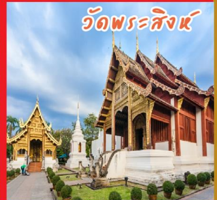
วัดพระสิงห์