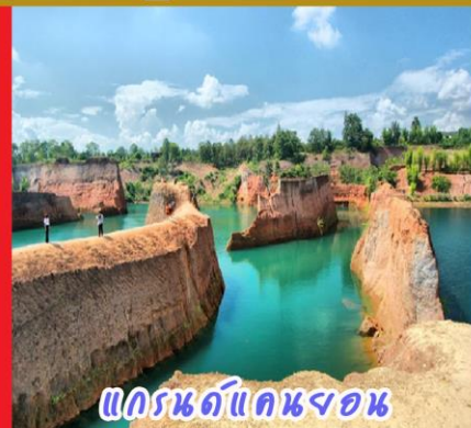
แกรนด์แคนยอน