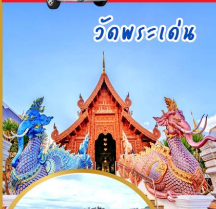
วัดพระเด่น