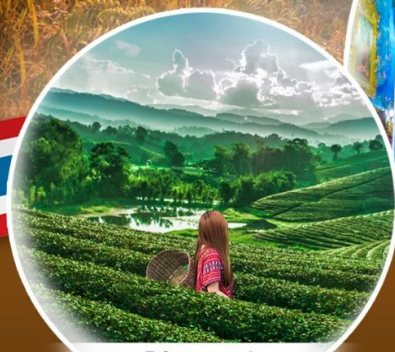
ไร่ชาดอยฟ่ง