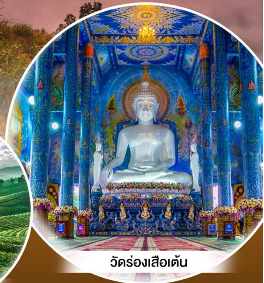
วัดร่องเสือเต้น