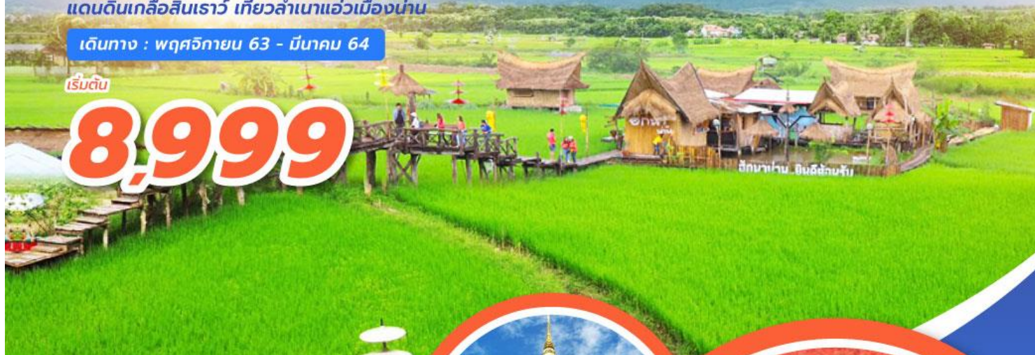
ดินนาบ้าน ดินดีข้าวดี