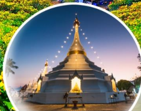
พระธาตุดอยกองมู