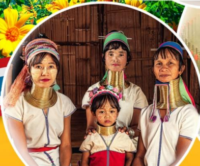
กะเหรี่ยงคอยาว