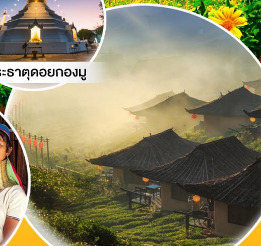
บ้านรักไทย