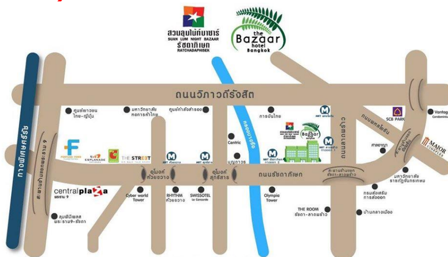
The Bazaar Hotel Bangkok 5 Ratchada Chomphon Chatuchak Bangkok Thailand 10900 Tel : +662 553 5555

21.00 น. ออกเดินทางสู่ จังหวัดเชียงใหม่ ให้ท่านพักผ่อนตามอัธยาศัย (หากมาช้าเกินกว่านี้ ท่านจะตกทริป และไม่สามารถเรียกร้องค่าเสียหายใดๆ ได้ทั้งสิ้น)