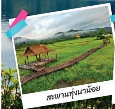
สะพานทุ่งน่าน้อย