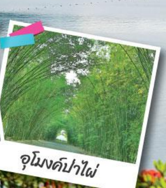
อุโมงค์ป่าไผ่