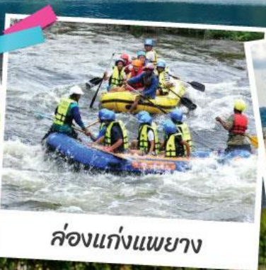
ล่องแก่งแพยาง