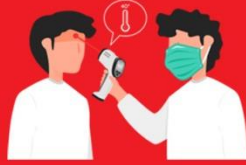
วัดไข้ผู้เดินทาง