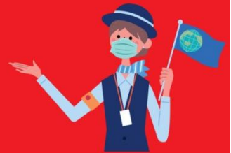
ไกด์ใส่แมสตลอดเวลา