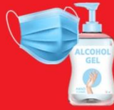
แจกแมส, เจล