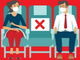
สายการบิน