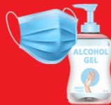
แจกแมส, เจล