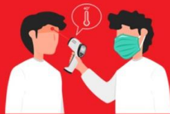
วัดไข้ผู้เดินทาง