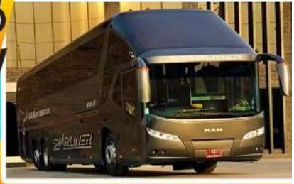
บัสวีไอพี มีเบาะนวด