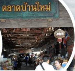
ตลาดบ้านใหม่