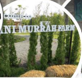
มินิมูร์รำห์ฟาร์ม