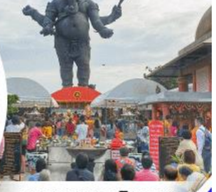
อุทยานพระพินนศ คลองเขื่อน

ส.ค.63 - ธ.ค.63 ทุกวันเสาร์และวันอาทิตย์