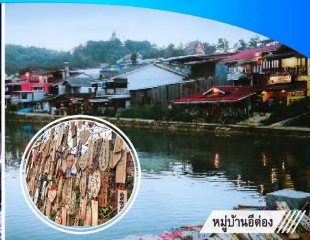
หมู่บ้านอีต่อง