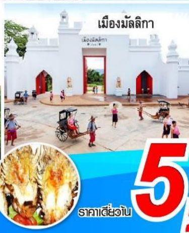
เมืองมัลลิกา