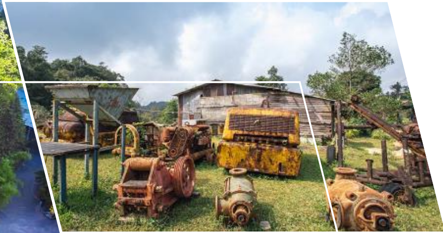
จากนั้นนำท่านเยี่ยมชมบรรยากาศของ เหมืองปิล็อกเก่า

แวะเดินเที่ยวถ่ายรูปเหมืองปิล็อกเก่าซึ่งก็มีพวกซากเครื่องมือเก่าๆ ที่เคยทำเหมืองสมัยก่อนในอดีต และถ่ายรูปตρω สะพานเหมืองแร่ อีกหนึ่งจุดถ่ายรูปสวยในหมู่บ้านก็ให้ท่านได้เก็บภาพความประทับใจ