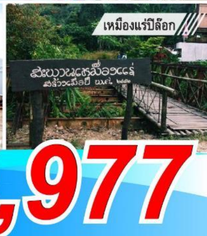
เหมืองแร่พิลึก