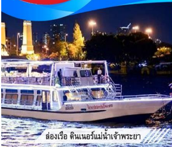
ล่องเรือ ดินเนอร์แม่น้ำเจ้าพระยา

เช็คอิน พิลึก ล่องเรือดินเนอร์แม่น้ำเจ้าพระยา