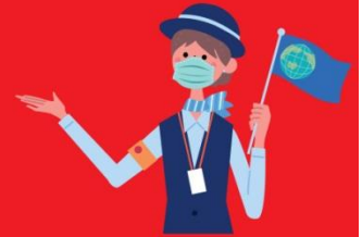
ไกด์ใส่แมสตลอดเวลา