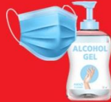
แจกแมส, เจล