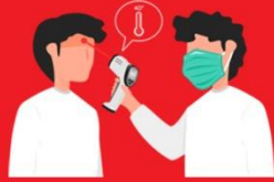
วัดไข้ผู้เดินทาง