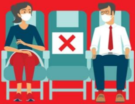
สายการบิน