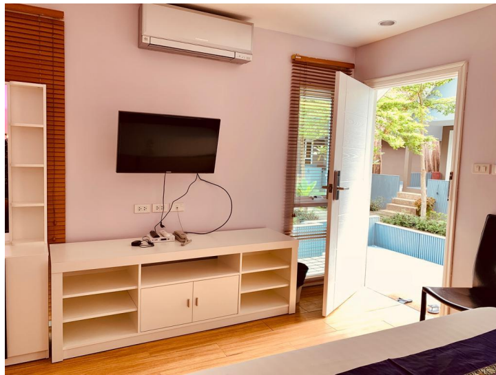
Beach Front Villa ໐໐ 3