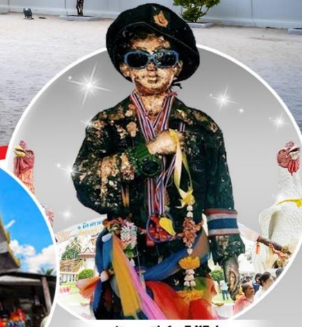
วัดเจดีย์ (ไอ้ไข่)