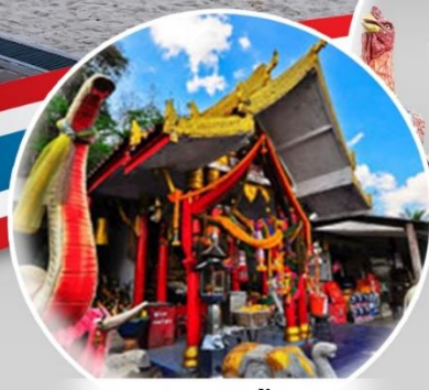
เวาตาหินช้าง

“ ขอพรเรื่องโชคลาภ เรื่องค้าขาย - วัดเจดีย์ (ไอ้ไข่) -