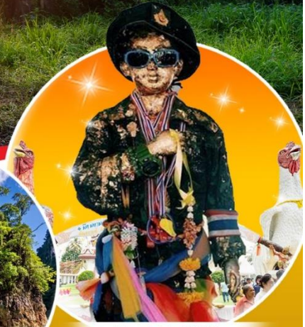
วัดเจดีย์ (ไอ้ไข่)