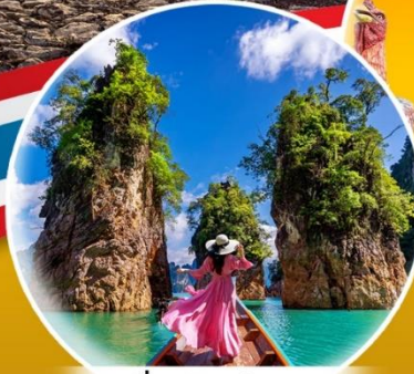
เขื่อนรัชชประภา