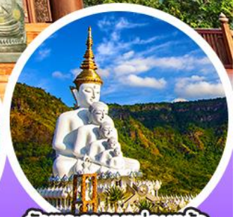
วัดพระธาตุผาซ่อนแก้ว