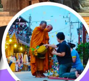
ตักบาตรข้าวเหนียว