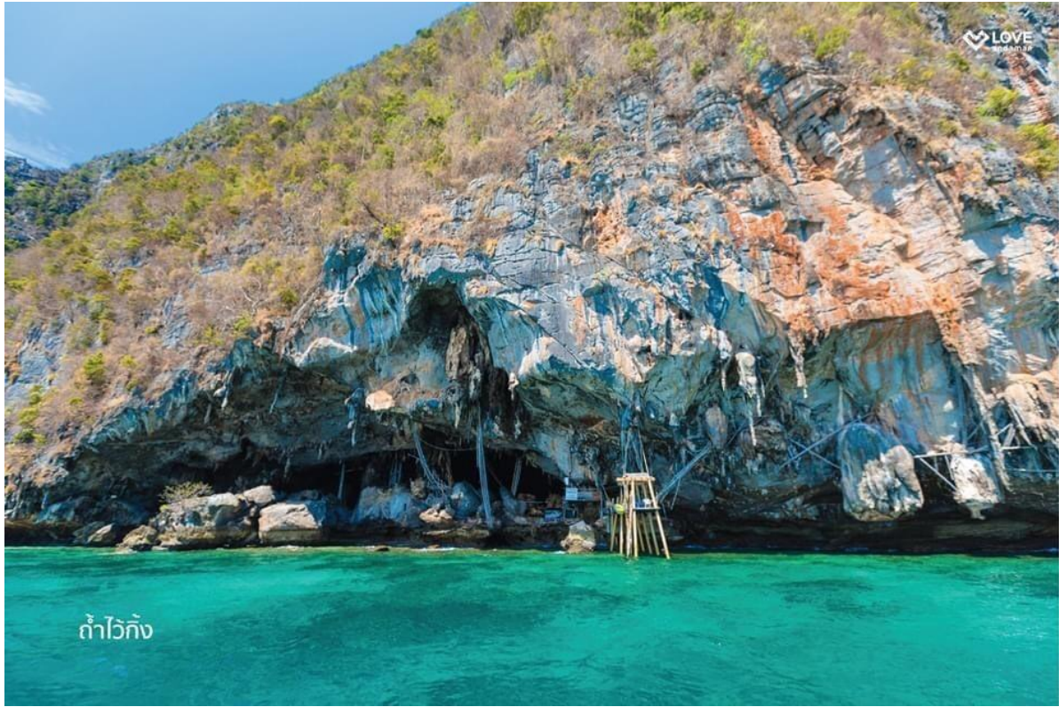
ถ้าไวกิ่ง " Viking Cave " อีกสถานที่ที่น่าค้นหา และยังเป็นฉากสำคัญในภาพยนตร์เรื่อง " The Beach " อีกด้วย