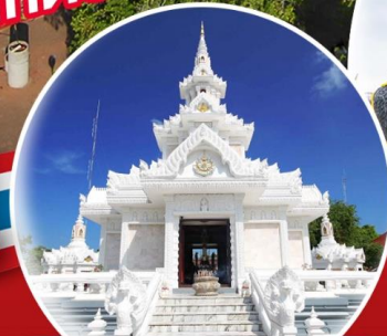
ศาลหลักเมืองนครศรีธรรมราช

ไหว้ทสอย บินเสาร์ - อาทิตย์ ไม่ต้องลงาน เพียง 12 ท่าน ออกเดินทาง โดยเครื่องบิน