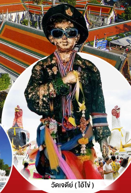
วัดเจดีย์ (ไอ้ไข่)