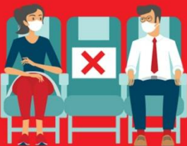
สายการบิน