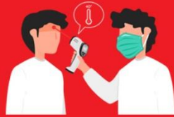
วัดไข้ผู้เดินทาง