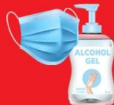
แจกแมส, เจล