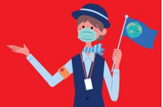
โกตีใส่แมสตลอดเวลา