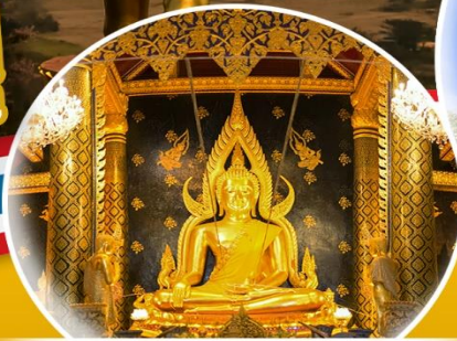
พระพุทธรชินราช วัดพระศรีรัตนมหาธาตุ