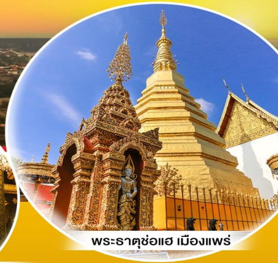
พระธาตุซ่อเอ เมืองแพร่