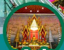
วัดโพธิ์ชัย