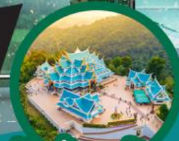
วัดป่ากู่ทอน