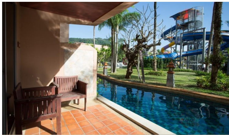
pool access room