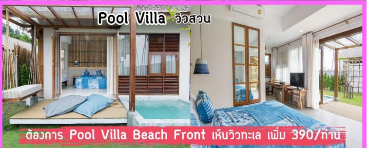
Pool Villa วิวสวน

ตัวอย่าง Pool Villa Beach Front เห็นวิวทะเล เพิ่ม 390/กาน.