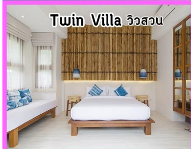
Twin Villa วิวสวน