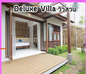
Deluxe Villa วิวสวน