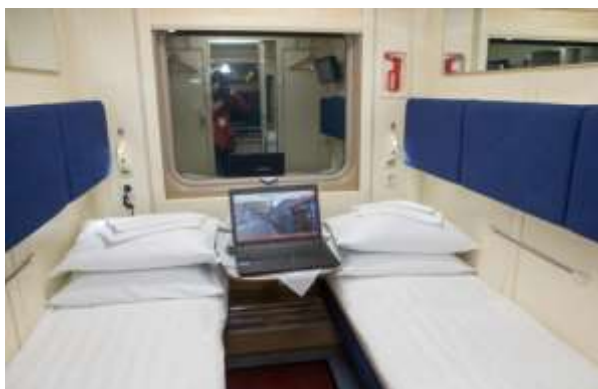
เตียงนอนแบบ 2 เตียงนอน

หมายเหตุ : หลังรับประทานอาหารค่ำ แนะนำให้ลูกค้าทุกท่าน เข้าห้องน้ำทำธุระส่วนตัวให้เรียบร้อย รถไฟจะถึง ชายแดนมองโกเลีย - รัสเซีย เวลาประมาณ 21.30 น. และจะใช้เวลาประมาณ 4 ชั่วโมง ในการตรวจเอกสาร เพื่อข้ามแดนระหว่างตรวจเอกสารทุกท่านจะต้องรออยู่ที่ห้อง ไม่สามารถใช้ห้องน้ำได้