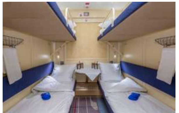
เตียงนอนแบบ 4 เตียงนอน